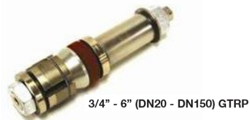
3/4" - 6" (DN20 - DN150) GTRP

Spesifikasjonene kan endres uten varsel.